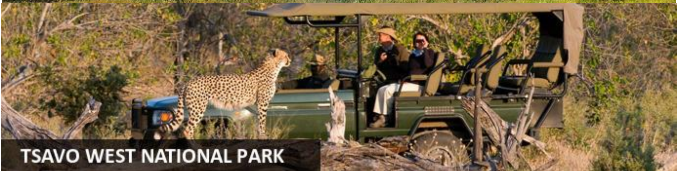
TSAVO WEST NATIONAL PARK